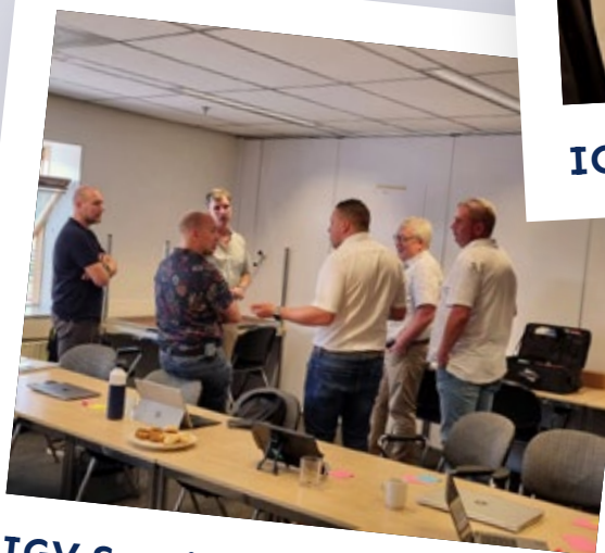
IGV Special GEO juni