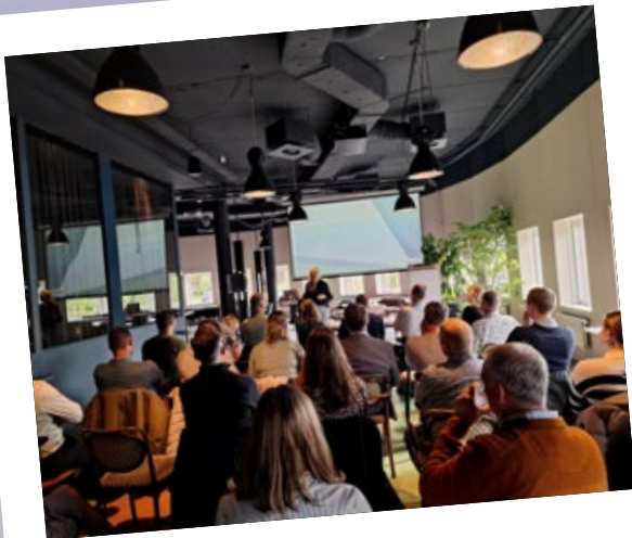
IGV Special AI Act