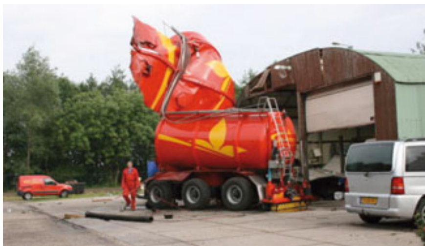
Resultaat van explosie tijdens reiniging tankwagencompartment

De effecten kunnen leiden tot persoonlijk letsel, zware ongevallen met dodelijke afloop en domino-effecten in de directe omgeving. De reikwijdte van de effecten zal in veel gevallen echter zeer lokaal zijn. Externe veiligheid zal minder snel in het geding zijn.