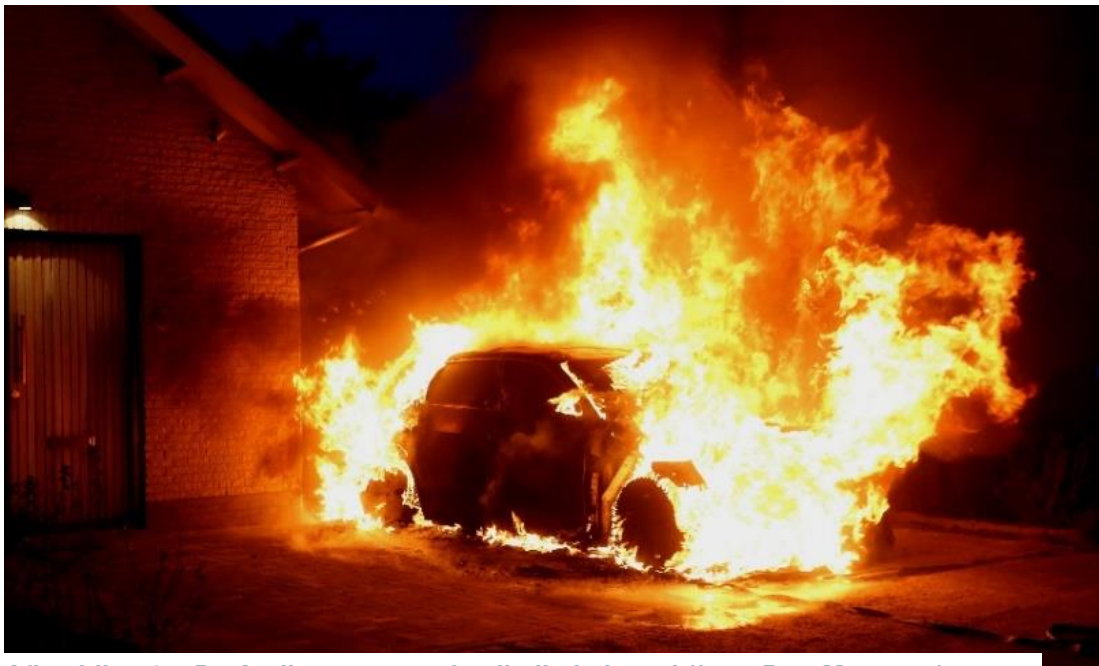
Afbeelding 2.1 De Audi e-tron stond volledig in brand

Al snel bleek dat het accupakket bij de brand betrokken was. Dit zorgde ervoor dat de brand telkens opnieuw oplaaide. Uit ervaring wist Rosenbrand dat het dan nodig was om langdurig te koelen met veel water en om het accupakket onder te dompelen. Hierop heeft hij direct de meldkamer gevraagd een dompelcontainer te alarmeren. Gezien de lange aanrijtijd van deze container, die uit Den Haag moest komen, en het feit dat het accupakket niet goed genoeg bereikbaar was om dit met lage druk te kunnen koelen, is ook een eigen containerbak van de brandweer ter plaatse gekomen. Deze wordt normaal gebruikt voor het vervoer van sloopauto's. De Audi stond tussen twee woningen in, en gezien het risico op eventuele uitbreiding naar de woningen wilde Rosenbrand de auto daar graag weg hebben.