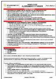
Aandachtskaart H 2 Brandstoftanks