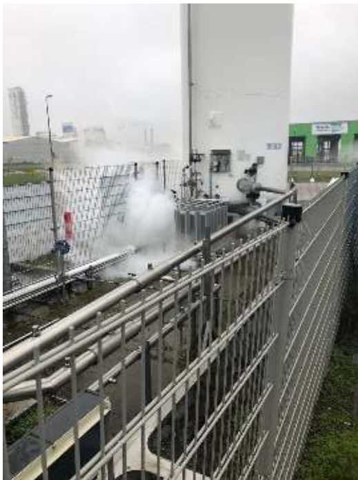
Afbeelding 8.2 Lekkage van de LNG-tank

elders in het land en een monteur op pad gestuurd. “Als brandweer omarm je die monteur zodra hij er is. Hij heeft immers deskundigheid over de installatie. Om de lekkage te verhelpen is zijn kennis en kunde essentieel. Vanaf dat punt ben je op twee sporen bezig. Het eerste spoor is het proberen de lekkage, met hulp van de monteur, zo snel mogelijk te dichten. Het tweede spoor is het veilige gebied in kaart brengen met metingen. Je zit namelijk met de overweging of je bijvoorbeeld de A15 of spoorverbinding moet afsluiten, omdat bij het veranderen van de windrichting de gaswolk over de A15 trekt.” De impact van een dergelijke afsluiting op de haven zou immers enorm zijn. Uiteindelijk is besloten dat het veilig genoeg was om de A15 en de spoorverbinding open te houden en alleen een zijvertakking van het spoornet, vlak langs het tankstation, tijdelijk buiten gebruik te stellen. “Deze keuze hoef je gelukkig niet alleen te maken: daarbij krijg je goede ondersteuning van de AGS en je multi-partners.”