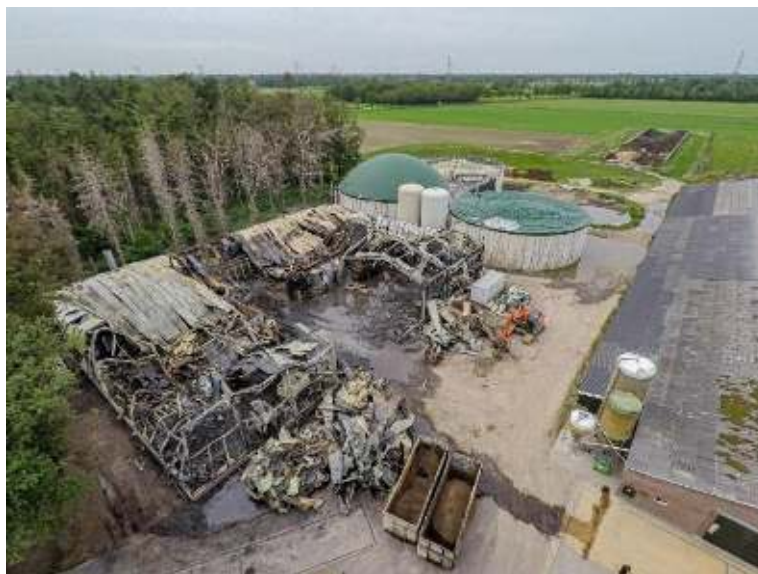
Afbeelding 5.2 Schade na de brand

Later meldde de installatiedeskundige dat het niet ging om 10.000 liter H 2 S, maar om enkele duizenden liters zwavelzuur. Een andere bijzondere factor was het feit dat een politiehelikopter boven het object hing om beelden te maken, terwijl het risico op een steekvlam door een gescheurde vergister bestond. “Die hebben wij vervolgens meer afstand laten houden, maar je krabt je op zo’n moment wel even achter de oren