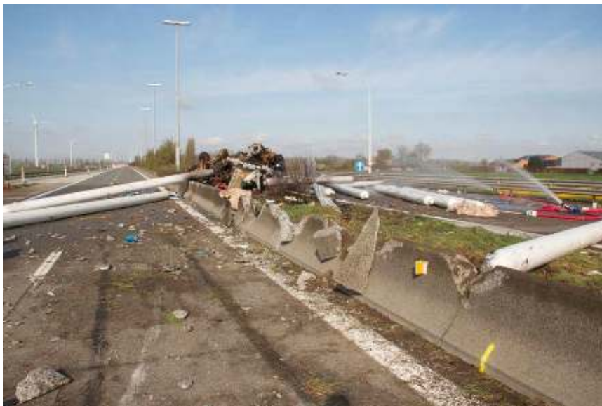
Afbeelding 7.2 De ravage op de snelweg