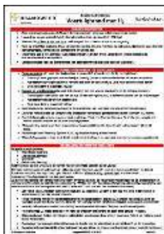
Aandachtskaart Voertuigbrand met H 2