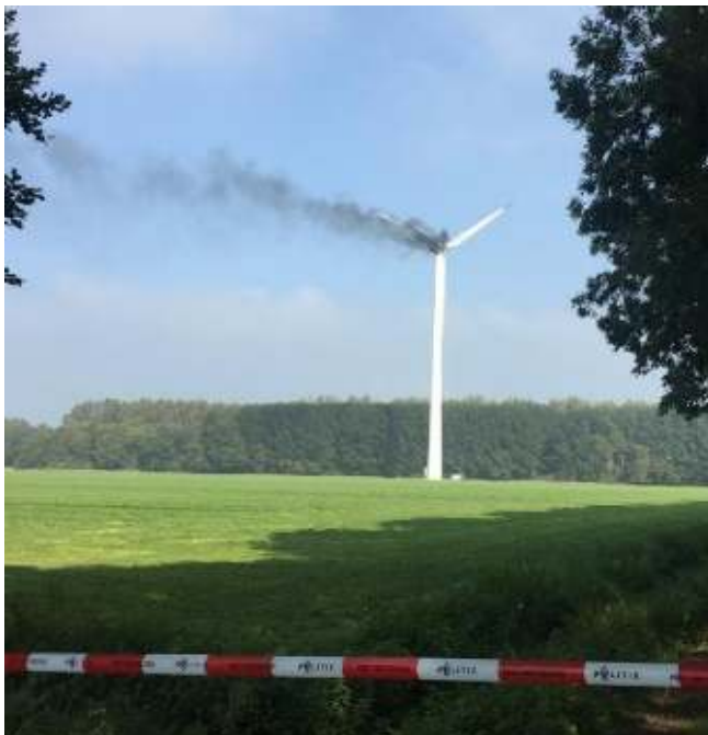
Afbeelding 1.2 De brand in de windturbine