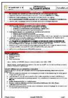
Aandachtskaart H 2 Tankstation