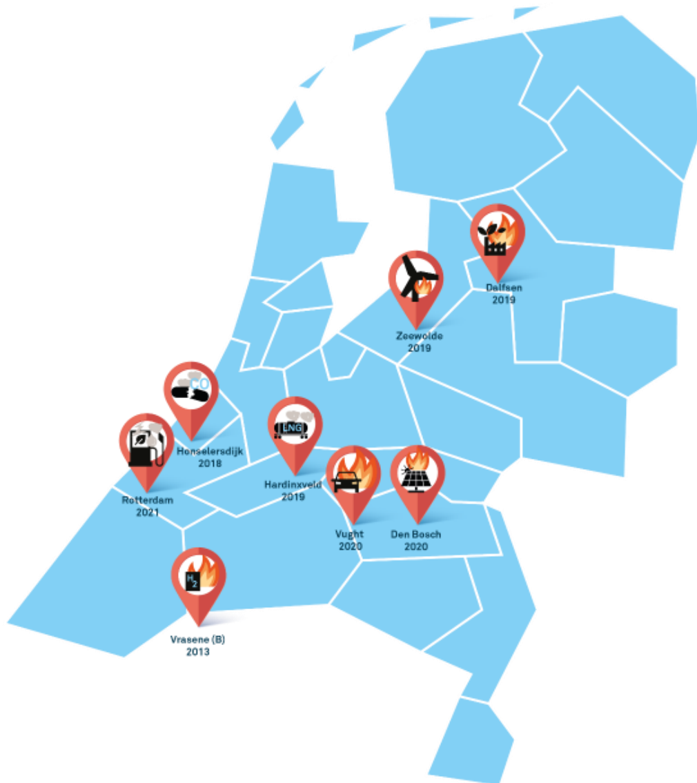
Figuur I.1 Locaties van de in dit infoblad beschreven incidenten