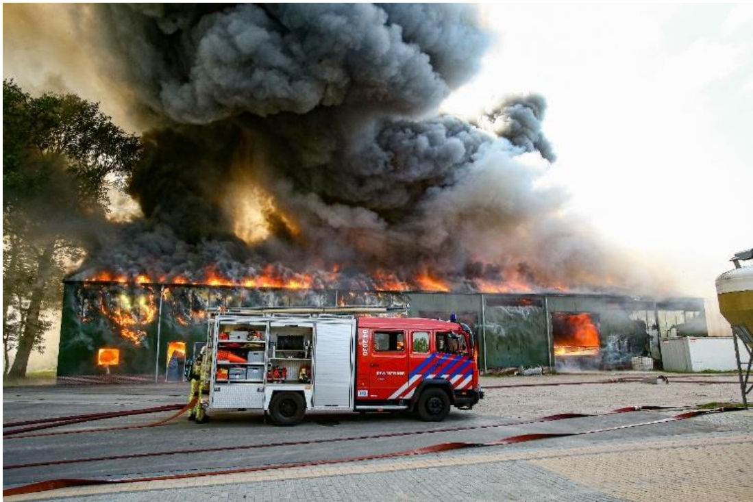
Afbeelding 5.1 Brand in de biovergistingsinstallatie in Dalfsen

Bij aankomst heerste er een hoop chaos rondom het object. Gezien de omvang van de brand is ingezet op een defensieve buitenaanval: er was gewoon niet genoeg koelend vermogen beschikbaar om de brand te kunnen bestrijden. Daarnaast was de waterwinning erg beperkt: er was op het terrein slechts een geboorde put aanwezig; voor de rest van de watertoevoer was Bos afhankelijk van tankwagens en later een grootwatertransport. De eerste prioriteit lag daarom volledig bij het voorkomen van uitbreiding naar de vergisters met gas aan de achterkant van de loods. Zouden die bij de brand betrokken raken en het gas vrijkomen, zou er een steekvlam kunnen ontstaan van vijftig meter hoog. Daarnaast was de affakkelininstallatie niet aangesloten, waardoor het affakkelen van het aanwezige gas niet mogelijk was.