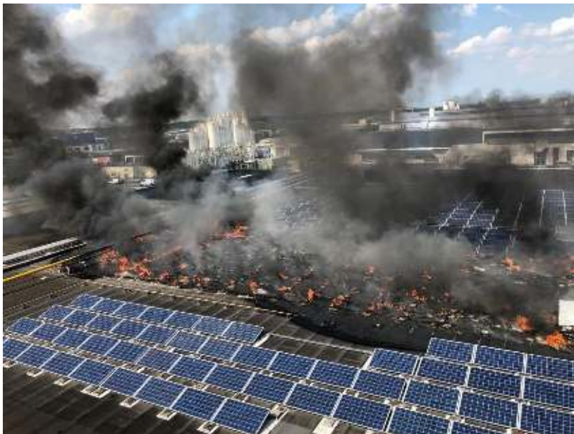
Afbeelding 6.1 Brand op het dak van de Heineken (foto: Brandweer Brabant-Noord)

Bij aankomst werd de brandweer opgevangen door de bhv'er. Deze is ingestapt en heeft meegereden in het blusvoertuig tijdens een rondomverkenning. Door de rondomverkenning kreeg Wouters snel een beeld van waar ongeveer op het dak de brand woedde en kon het voertuig op de juiste plaats worden gepositioneerd. De bhv'er aan boord bevestigde dat er zonnepanelen in brand stonden. Daarnaast wist Wouters uit zijn inwerktraject dat er een gasleiding op het dak liep.