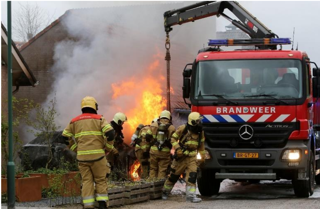
Afbeelding 2.2 De auto wordt in een containerbak geplaatst

Rosenbrand kijkt met een goed gevoel terug op deze inzet. Door de eerste tankautospuiter is goed opgetreden door in te zetten op het voorkomen van uitbreiding. Ook was iedereen zich, nog meer dan normaal, bewust van de toxische rook die bij dit soort incidenten vrijkomt en heeft daarnaar gehandeld. Wel voegt Rosenbrand toe: “Een volgende keer zou ik wel sneller de juiste informatie boven tafel willen hebben. Op het moment van het incident hadden wij nog niet de beschikking over CRS [Crash Recovery System]. Hierdoor moesten we online op zoek naar informatie over het voertuig. Met de juiste hulpmiddelen heb je sneller deze informatie boven tafel, waardoor je je een beter beeld kan vormen over het incident.”