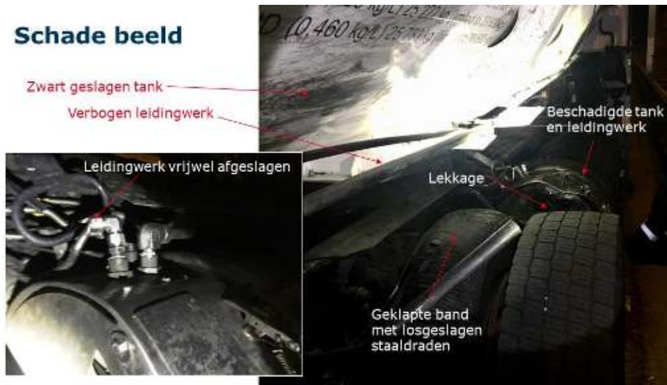
Afbeelding 4.2 Beeld van de lekkende LNG-tank