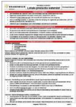
Aandachtskaart Lokale productie waterstof