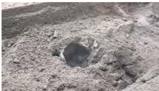
Afbeelding 3.1 Beeld van de leidingbreuk

Er was door de OvD al ruim afgezet met een opstellijen op enkele honderden meters vanaf het lek. Binnen honderd meter van het lek werd ademlucht gedragen. Het was goed te zien dat het CO 2 zich gedroeg volgens het verwachte patroon (laag bij de grond blijven en zich verplaatsen naar de dieper gelegen delen) en zich ophoopte in bijvoorbeeld slootjes. Later in het incident is, door het verspreidingsgebied van het CO 2 goed in kaart te brengen, het afgezette gebied verkleind tot 25 meter rondom het lek.