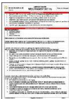
Aandachtskaart Wegtransport H 2