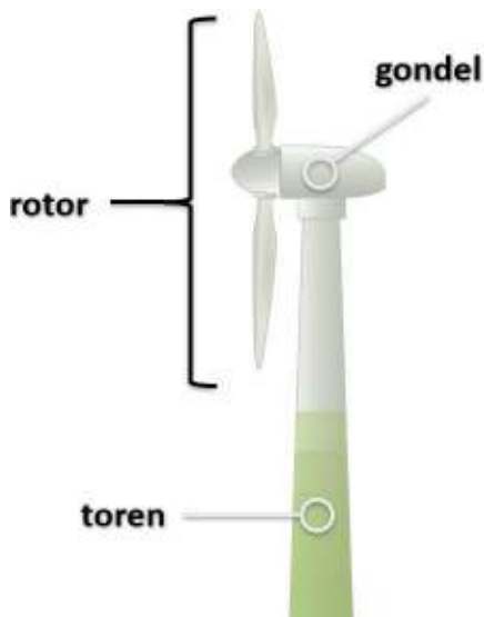
Figuur 1.1 Schematische impressie van een windturbine

Voor de brandweer bestaat een windturbine doorgaans uit drie hoofdonderdelen: de rotor, de gondel en de toren. Dit is schematisch weergegeven in Figuur 1.1. In de aandachtkaart Bestrijding incidenten windturbine , opgenomen in Bijlage 1, wordt uitgebreid ingegaan op de verschillende onderdelen die aanwezig zijn in de gondel.