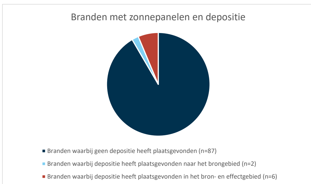
Figuur 2.2 Aantal branden met zonnepanelen en depositie

Een vergelijking van de mediaberichten en de resultaten van de vragenlijst laat zien dat er bij vier extra branden sprake is geweest van depositie. In totaal heeft er bij in ieder geval 8 van de 95 gevonden zonnepaneelbranden depositie plaatsgevonden. Bij 2 van deze acht branden heeft er alleen depositie op de incidentlocatie heeft plaatsgevonden. In figuur 2.2 is het aantal branden waarbij depositie heeft plaatsgevonden in het brongebied en branden waarbij er ook depositie heeft plaatsgevonden naar een effectgebied, afgezet tegen het totaal aantal branden. Bij deze branden heeft, voor zover bekend, geen depositie heeft plaatsgevonden.