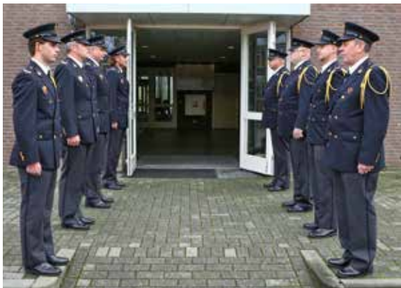
Afbeelding 5A en 5B: Erehaag buiten

Zodra men in de houding staat kijkt men uitsluitend strak vooruit en kijkt men naar de knoop van de stropdas van de tegenover opgestelde collega. Het is van belang dat men hierbij niet om zich heen gaat kijken. Vlak voordat de stoet door de erehaag rijdt of de kist door de erehaag wordt gedragen of begeleid, volgt het