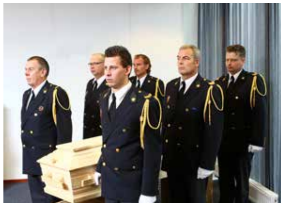
Afbeelding 7: Neerzetten van de kist

Bekijk de instructievideo 'Binnendragen' op www.brandweernederland.nl/uitvaart