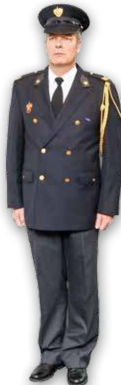
Afbeelding 1: Aannemen van de houding

Wanneer vanuit de rusthouding de houding wordt aangenomen, worden de voeten bij elkaar geschoven en wordt het lichaam gestrekt. De hakken van de schoenen staan tegen elkaar, de voeten iets uit elkaar. De armen zijn gestrekt langs het lichaam, waarbij de duimen van de gebalde vuist zijn geplaatst op de bies van de broek of de rok. Als de houding gelijktijdig door een groep brandweermensen moet worden aangenomen, kan er een zacht uitgesproken commando 'geeft ... acht' aan voorafgaan.