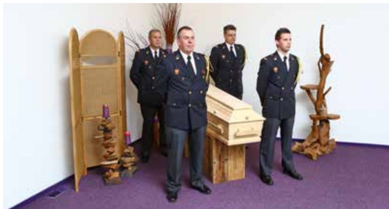
Afbeelding 4: Dodenwake

Afhankelijk van de (beperkingen van de) ruimte kan het voorkomen dat men hierin iets moet improviseren.