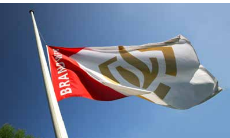
Afbeelding 3: Brandweervlag halfstok

In deze volgorde worden de vlaggen ook gehesen en gestreken.