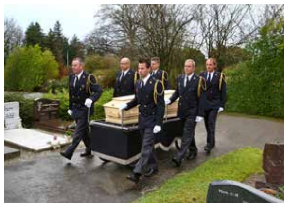
Afbeelding 8: Begeleiden rolbaar

Deze afbeelding geeft een indruk van hoe het begeleiden van een rolbaar eruit ziet.