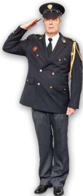
Afbeelding 2: Brengen van de groet

Wordt er gegroet zonder hoofddeksel, dan draag je de pet met de klep naar voren onder je linkerarm.