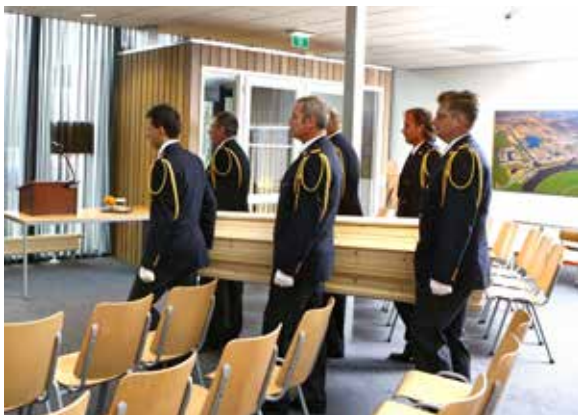
Afbeelding 6: Binnendragen van de kist