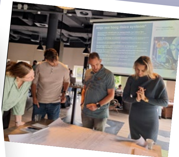
IGV Special AI Act