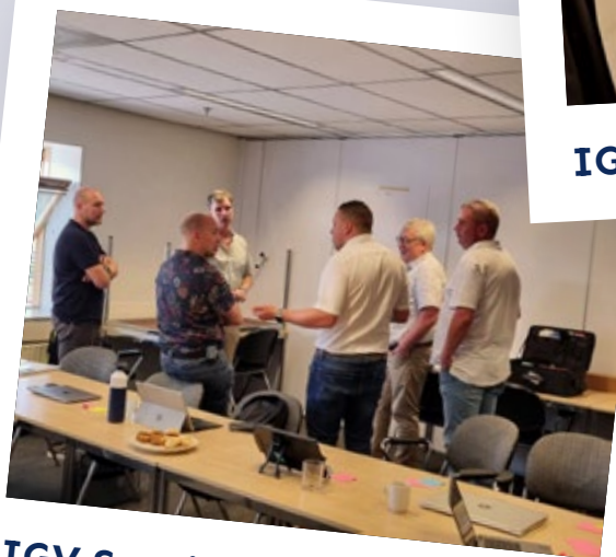
IGV Special GEO juni