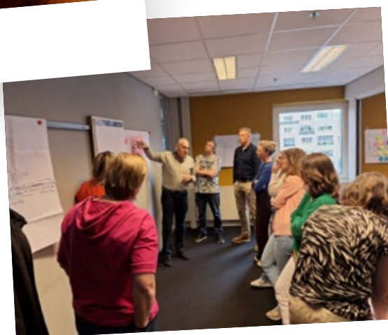
IGV Special digitale fitheid