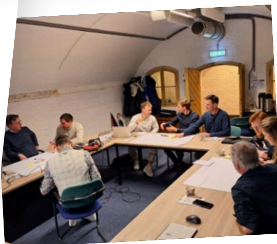
IGV Special GEO maart