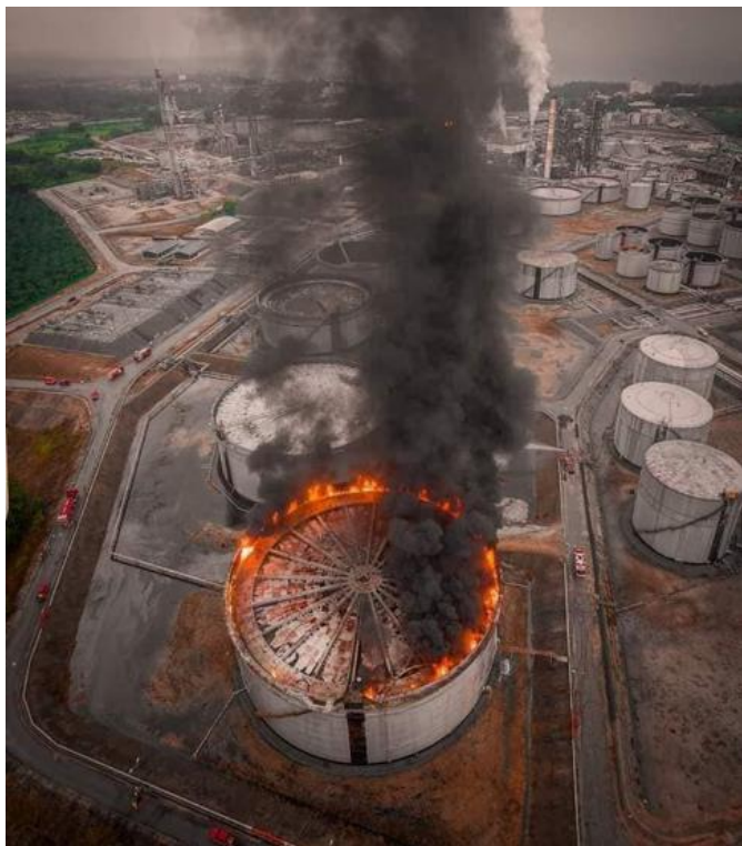
Figuur 1; rimbrand