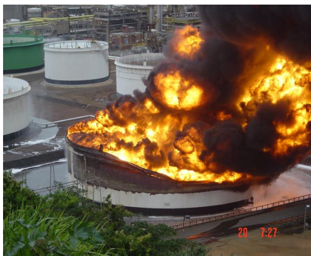
Figuur 2; volledige tankbrand

vervangen of aangepast, zodat wel aan de NFPA 11 wordt voldaan;