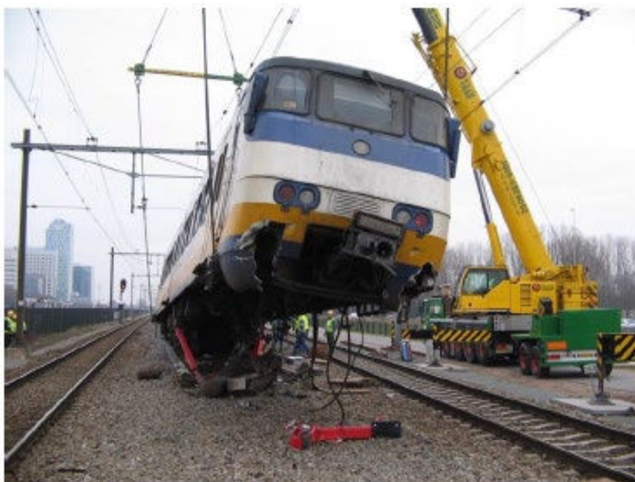
Figuur 3.3 Sprinter in de takels na rammen stootblok in Amsterdam

Een treinongeval is per definitie aanleiding voor nader onderzoek. Los van het feit dat het de start markeert van een eigen onderzoek door de spoorsector, zal ook de Onderzoeksraad voor Veiligheid al tijdens de incidentfase kenbaar maken of zij een onderzoek instelt. Hulpverleners en andere direct betrokkenen kunnen in het kader van onderzoek direct of later na het incident opgeroepen worden voor een reconstructie. Daarnaast kan pas gestart worden met opruim- en herstelwerkzaamheden als de situatie van het ongeval nauwkeurig geregistreerd is, om te voorkomen dat sporen die van belang zijn voor het (strafrechtelijk) onderzoek (onbewust) gewist worden.