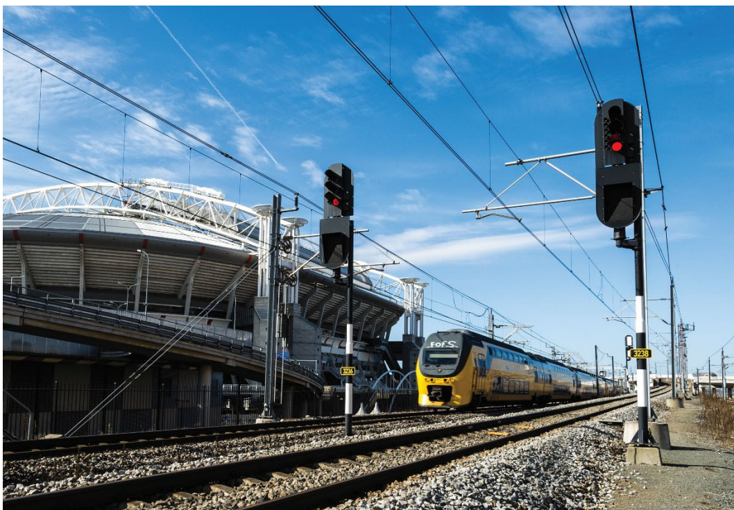
Figuur I.1 Intercity

Een ander belangrijk uitgangspunt van de handreiking is de al aanwezige en meer algemene monodisciplinaire basiskennis en expertise van overheidshulpdiensten en spoorpartijen. Generieke aspecten die betrekking hebben op incidentbestrijding en crisisbeheersing worden daarmee bekend verondersteld bij de lezer en zijn daarom niet nog een keer opgenomen. Een voorbeeld is het inzicht in de (wettelijke) taken, verantwoordelijkheden en bevoegdheden van partijen die betrokken kunnen zijn bij een incident op het spoor. Omdat deze informatie ook al in andere publicaties is opgenomen, wordt hiernaar doorverwezen in de tekst. Een bijzondere vermelding gaat uit naar een belangrijk document waar deze handreiking op aansluit: het Handboek Incidentmanagement Rail (HIR) van ProRail.