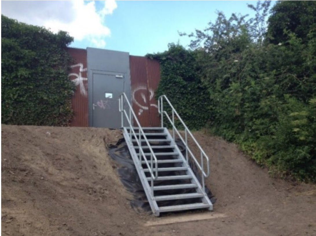
Figuur 2.3 Vluchttrap