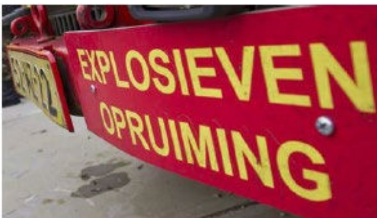
Figuur 3.5 EODD, dreigingsscenario station

Tijdens een drukke ochtendspits staat een Intercity op Rotterdam-Centraal, spoor 13, te wachten op vertrek naar Utrecht. Een reiziger meldt bij de conducteur dat er al een tijd een tas onbeheerd in een coupé staat. De conducteur gaat kijken en ziet iets uit de tas steken. Hij vertrouwt het niet en meldt dit bij de Meldkamer NS. De conducteur spreekt twee agenten aan, die contact zoeken met het Operationeel Centrum (OC). De agenten beginnen met het evacueren van de trein en het vrijmaken van het perron; de locatie wordt 'klein afgezet' met afzetlint op circa 50 meter rondom de plek. De treindienstleider zal conform de procedure 'verdacht object' zijn maatregelen treffen, waaronder het niet laten stoppen van treinen op naastgelegen sporen en perrons. Het verkeer wordt zo mogelijk omgeleid. De OvD-P besluit om de Teamleider Explosieven Verkenner (TEV) ter plaatse te laten komen. Andere operationeel leidinggevenden (OvD-B en OvD-G) worden zo nodig telefonisch op de hoogte gebracht van de situatie door een centralist van de GMK.