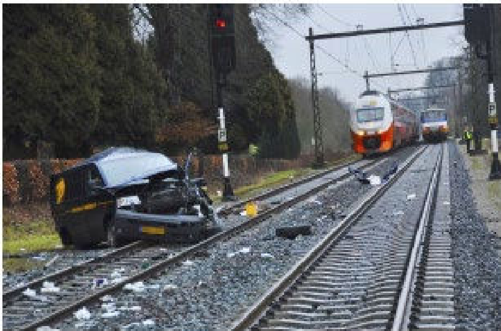
Figuur 3.2 Aanrijding voertuig

Bij het Operationeel Besturingscentrum Infrastructuur (OBI) van ProRail signaleert men dat de bovenleiding gebroken is. De bovenleidingspanning wordt uit voorzorg afgeschakeld. Het incident zal landelijke aandacht krijgen in de media en via sociale media. Er zijn veel slachtoffers bij dit incident te verwachten. Diverse processen moeten worden opgestart, waaronder de zorg voor en registratie van slachtoffers, opvang, nazorg en de crisiscommunicatie. Hiervoor worden diverse actiecentra ingericht.