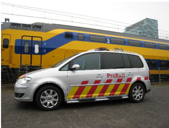
Figuur 1.1 Voertuig OvD-Rail

ProRail heeft een eigen incidentbestrijdingsorganisatie (ProRail Incidentenbestrijding) die opereert vanuit verschillende locaties in Nederland. De voertuigen van ProRail incidentenbestrijding mogen ook met optische en geluidssignalen rijden (en zijn dan dus voorrangsvoertuigen, met de hiermee gepaard gaande ontheffingen van het Reglement Verkeersregels en Verkeerstekens (RVV 1990). Hierbij valt – mits veilig en binnen de in de brancherichtlijnen gestelde grenzen – te denken aan het door rood licht rijden of harder rijden dan de maximaal toegestane snelheid. Het incidentbestrijdingsteam van ProRail, aangevoerd door een ploegleider, heeft technische kennis van de infrastructuur, van spoorwegmaterieel en van afsluiters van spoorwagons.