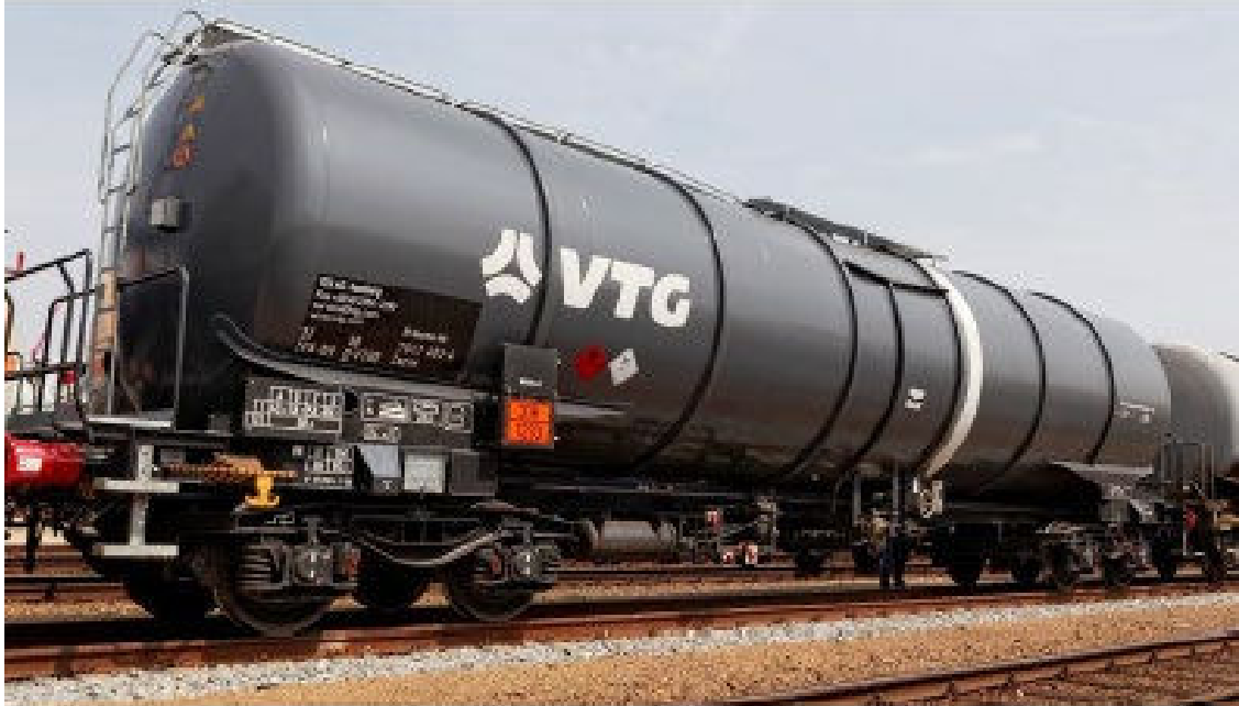
Figuur 2.4 Spoorketelwagon

hierover. Zo werkt ProRail aan (operationele) informatiekaarten met specifieke bijzonderheden per materieelsoort. Dit zijn kaarten die vergelijkbaar zijn met de informatie die de brandweer kent uit het Crash Recovery System voor wegvoertuigen.