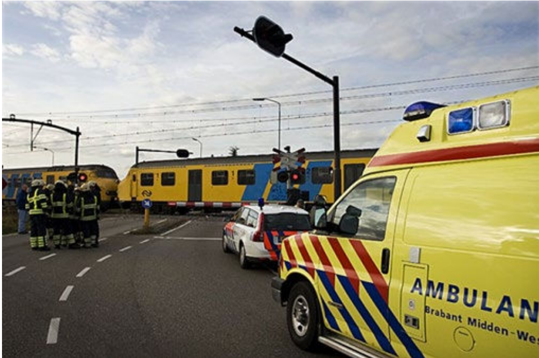
Figuur 2.1 Opstelplaatsen hulpverleningsvoertuigen