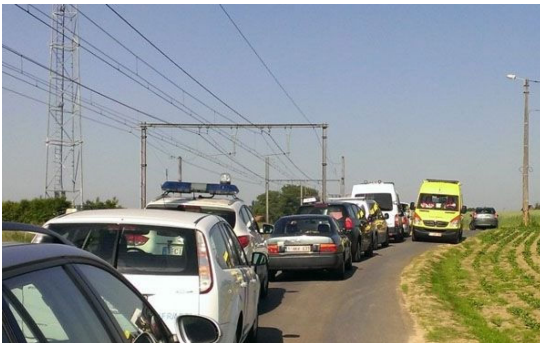
Figuur 2.2 Bereikbaarheid hulpdiensten

omstandigheden (lees: mogelijkheden), maar ook of een traject structureel gebruikt wordt voor het vervoer van gevaarlijke stoffen (met het oog op het groepsrisico 8 ).