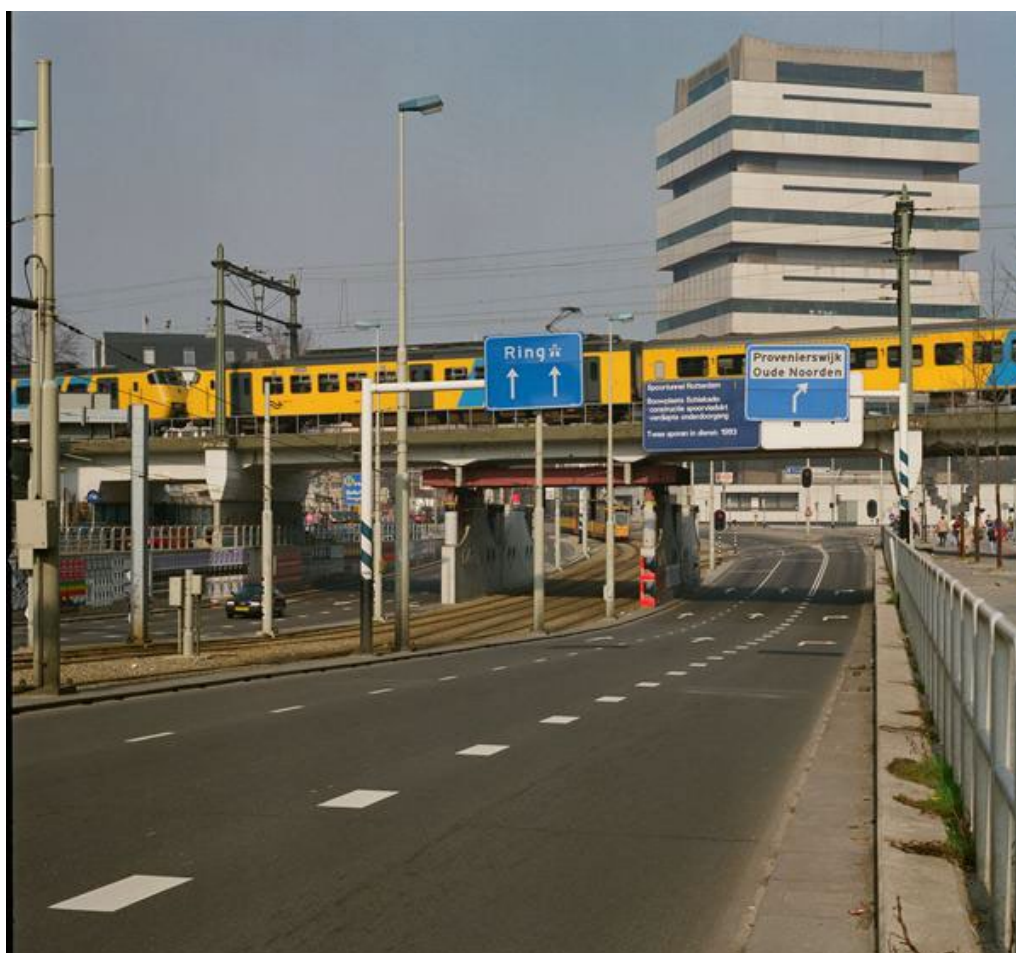
Figuur 1.2 Kruisende verkeerstromen

Ter toelichting: Waar de burgemeester aan zet is bij een ramp of crisis met een plaatselijke betekenis, is de voorzitter van de veiligheidsregio aan zet als de crisissituatie een bovenlokaal karakter heeft, of bij ernstige vrees voor het ontstaan daarvan. In de praktijk zal de woordvoerder van de brandweer, veiligheidsregio of politie de communicatie richting de bevolking opstarten. Bij opschaling naar een team bevolkingszorg (vanaf GRIP 2 of GRIP 3; afhankelijk van regionale afspraken) is het team bevolkingszorg verantwoordelijk voor het coördineren en verzorgen van de crisiscommunicatie.