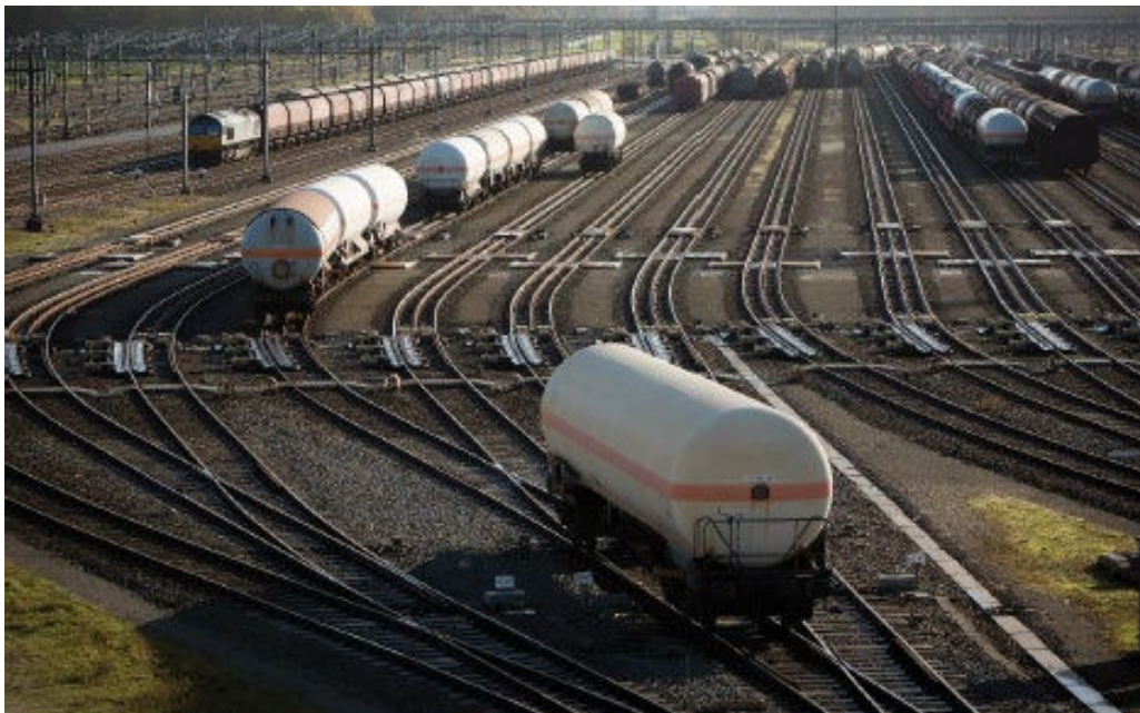
Figuur 4.1 Spooremplacement Kijfhoek

Een spooremplacement is vergunningplichtig op grond van de Wet algemene bepalingen omgevingsrecht (Wabo). Hierbij is de gemeente het bevoegd gezag. De Wabo stelt dat voorzieningen gebaseerd moeten zijn op de 'best beschikbare technieken' (BBT), op een kosten-batenanalyse, kosten-effectanalyse en/of ze technisch haalbaar zijn in de bedrijfstak waartoe de inrichting behoort. Anderzijds biedt de Wet veiligheidsregio's (Wvr) de mogelijkheid om eisen en voorwaarden te stellen aan bedrijfsbrandweren. Hier is de veiligheidsregio bevoegd gezag.