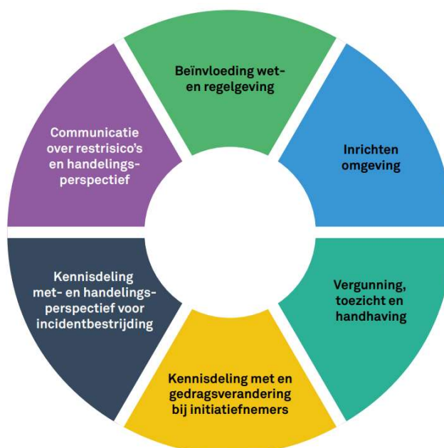
Figuur 2: de zes sporen van beïnvloeding

Zoals uit het juridisch kader blijkt, zijn met het toepassen van wet- en regelgeving niet alle problemen in de afvalbranche op te lossen. Naast het inzetten op advisering bij vergunningverlening, zijn er andere manieren beschikbaar om de veiligheid bij de doelgroep te verhogen. Er kan ingezet worden op een ander – niet juridisch – spoor uit de zes sporen van beïnvloeding 9 . Door niet de juridische weg te gaan (VTH-spoor), maar met de afvalbedrijven in gesprek te gaan over de scenario's en mogelijke maatregelen, kan een gedragsverandering worden bereikt. Het nemen van maatregelen komt dan vanuit een intrinsiek urgentiegevoel en hoeft zodoende ook niet per se juridisch geborgd te worden.