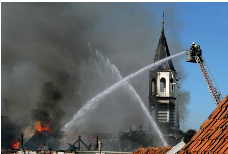
Amersfoort, Armando Museum 2007

Daarnaast is het Programma Brandveilig Leven in gang gezet. In Brandveilig Leven staat de eigen verantwoordelijkheid en de zelfredzaamheid van de burgers en instellingen voorop. Voor erfgoedbeheerders geldt dit uitgangspunt ook.