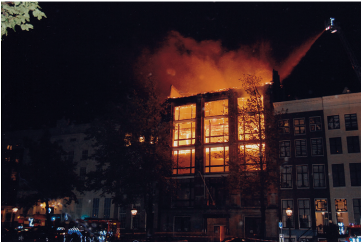
Keizersgracht, Amsterdam, 2011, foto: Ronald Driessen

De plannen over hoe te handelen tijdens de verschillende fases van een incident moeten vooraf en in gezamenlijk overleg gemaakt worden.