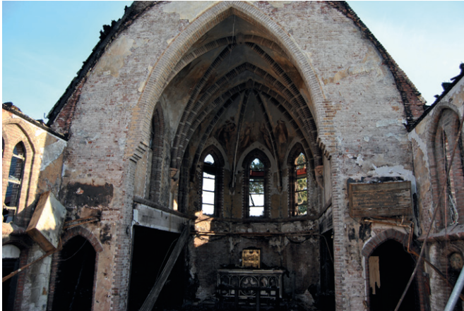
Sint Clemenskerk, Ameland, 2013