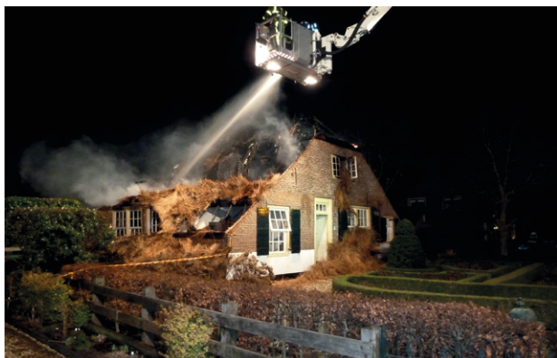
Brand woonboerderij Hei- en Boeicop, 2013