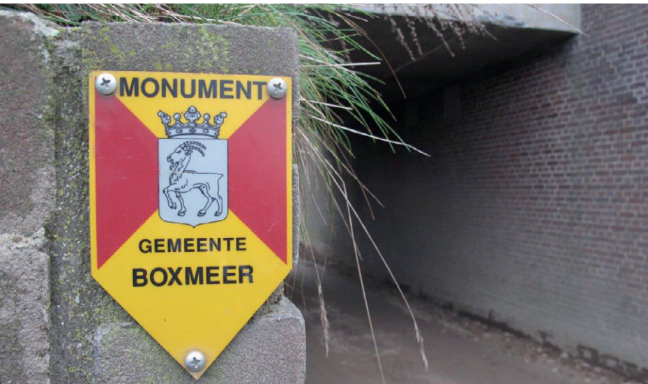
Onderdoorgang Veerweg Gemeente Boxmeer, een gemeentelijk monument.

De huidige praktijk (zoals die ook in bestudeerde casuïstiek naar voren komt) is dat brandweereenheden die naar een pand uitrukken (vrijwel) nooit informatie krijgen over de monumentenstatus van dat pand of de cultuurhistorische inventaris van dat pand. Door het ontbreken van die informatie zijn brandweereenheden ook niet in staat om rekening te houden met deze monumentenstatus of de cultuurhistorische waarde van de inventaris. Er zou gekeken kunnen worden of deze informatie bij het uitrukken meegegeven kan worden, bijvoorbeeld door de centralist. Repressief brandweerpersoneel zou ook geleerd kunnen worden om te letten op de aanwezigheid van 'schildjes' aan de gevel van een bouwwerk (bij een pand meestal naast de voordeur) die aangeven of het om een monument gaat. Er is echter een grote diversiteit aan schildjes zoals rijksmonumentschildjes en schildjes voor gemeentelijke of provinciale monumenten. Bovendien zijn deze schildjes niet altijd aanwezig of zichtbaar en ze zeggen alleen iets over de cultuurhistorische waarde van het pand, niet over de collectie. Daarnaast moeten deze schildjes niet verward worden met de blauwwitte schildjes, die wijzen op een bijzonder object dat in geval van oorlogsdreiging en natuurrampen bescherming verdient en niet wijzen op een rijksmonument (vaak zijn het ook wel rijksmonumenten). 6