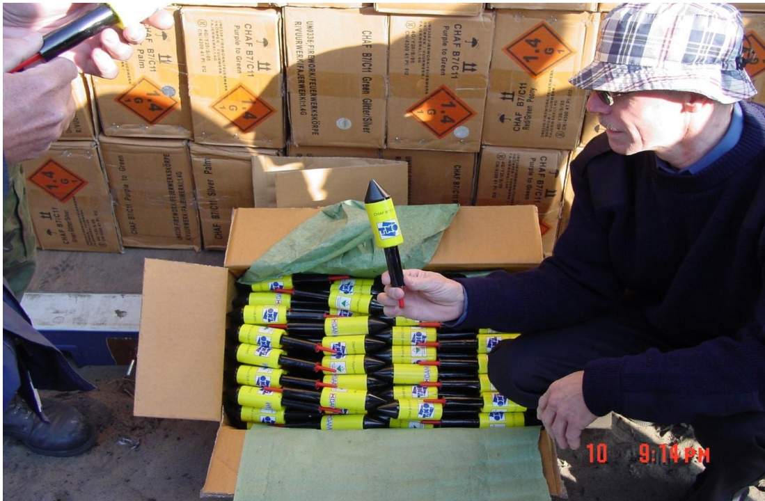
Figuur 5.1 Container met vuurpijlen zonder stok

Op 15 november 2005 is op uitnodiging van het toenmalige ministerie van VROM een overleg georganiseerd waarbij naast de begeleidingscommissie van het CHAF-project ook vertegenwoordigers van onder andere de brandweer aanwezig waren. Doel van de bijeenkomst was “om helderheid te krijgen over de achtergrond van de onrust, om uitleg te kunnen geven over de proeven en om gezamenlijk tot conclusies te komen over de geldigheid van de brandweerinstructies.” 73 Vanwege het belang van dit overleg, is het verslag ervan opgenomen in bijlage 7. De gezamenlijke conclusie die het doel was van het overleg is er gekomen en luidt dat “alle aanwezigen de conclusie onderschrijven dat de resultaten van de proef in Polen op zich geen reden zijn om tot een andere benadering van vuurwerkbranden over te gaan. Wel heeft de discussie hierover tot een scherpere formulering geleid [...]” Toch wordt tot op heden de bewuste foto veelvuldig aangehaald als bewijs dat consumentenvuurwerk (subklasse 1.4) een massa-explosie kan geven. 74